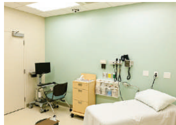
Ambulatori medici o dentistici