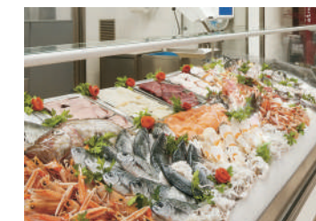
Magazzini conservazione pesce