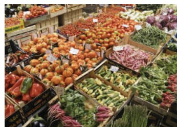
Magazzini conservazione frutta e verdura